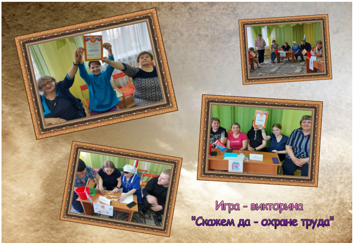
Игра - викторина "Скажем да - охране труда"